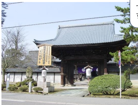
毫攝寺 (真宗出雲路派本山)

お寺のお堀には、なんと600年前からメダカが棲んでいるらしい、というお寺です。ほんとかな？